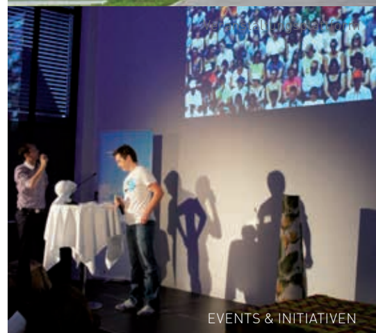
EVENTS & INITIATIVEN