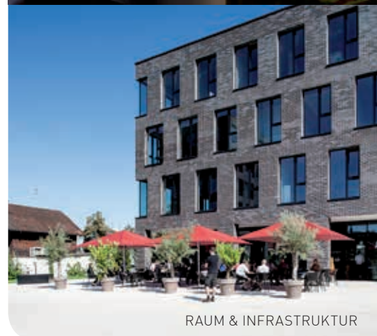
RAUM & INFRASTRUKTUR